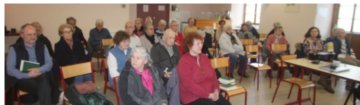
Lors de l'assemblée générale différents points ont été abordés